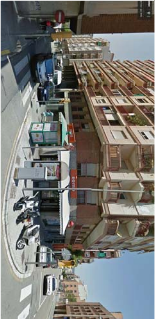
VISTA LOCAL ESC. NATZARET/CASTELAO